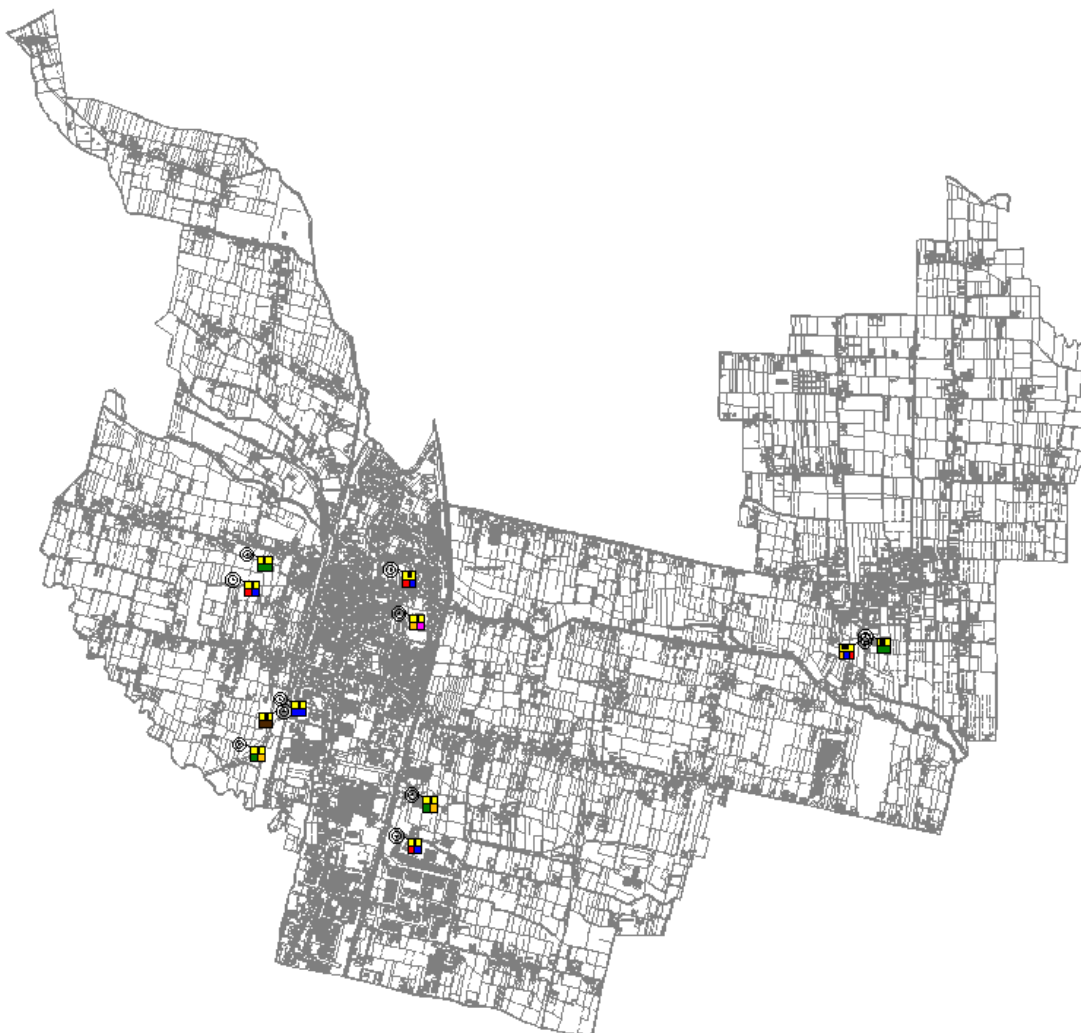
Estratto Tavola Catasto Siti

Nell'immagine seguente è riportato un estratto della "Tavola n.1 Catasto siti" in cui si può osservare la corretta collocazione dei diversi impianti sopra elencati.